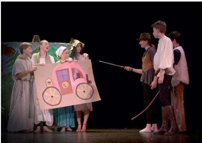
Základní škola náměstí Míru Liberec pod vedením Zuzany Poplužníkové